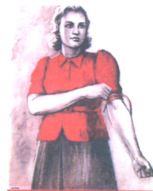
БЫТЬ ДОНОРОМ - ВЕЛИКАЯ ЧЕСТЬ ДЛЯ ПАТРИОТА

«Окна» - это плакаты, создававшиеся в 1919-1921гг советскими художниками и поэтами, работавшими в системе Российского телеграфного агентства (РОСТА). В 1925г оно было переименовано в «Телеграфное агентство Советского Союза» (ТАСС). «Окна» - своеобразный вид агитационного искусства, возникший в период гражданской войны. В «Окнах» работали такие известные художники и поэты, как