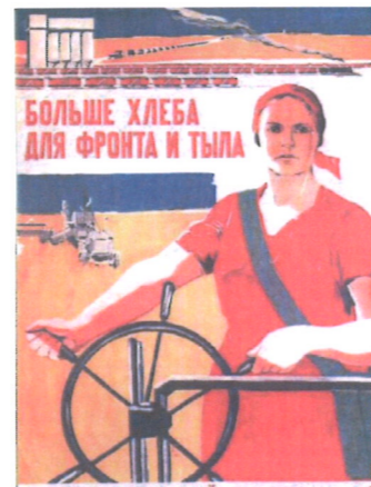
БОЛЬШЕ ХЛЕБА ДЛЯ ФРОНТА И ТЫЛА

подруга. В советском плакатном искусстве появляется образ женщины-жертвы фашистского нашествия, страдающей, нуждающейся в защите. Символический образ немолодой женщины авторы наделяли лучшими чертами современницы - силой, мужеством, решительностью. Патриотическая, антифашистская идея звучит в плакате громко и впечатляюще. Фигура матери является одним из символов русской земли, ее женственный лик закреплен