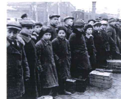
Дети ждут эвакуации – Die Kinder warten auf ihre Evakuierung