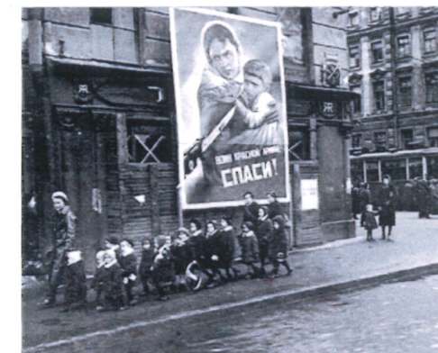
Жизнь нормализуется – Das Leben normalisiert sich

В Ленинграде погибли миллион человек. Это число могло бы быть гораздо выше, если бы не существовала «дорога жизни».